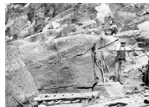
5 Groeve in Engeland, goed te zien is het breken van de steen met beitels en stootijzer

Engelse zandsteen bleek van zeer goede kwaliteit voor het pellen. De omtrek was vaak 1.80 m en de zijkant tot 30 cm dik. Een oppervlak met veel glimmers wees op een sterke pelsteen. De meeste slijtage trad op aan de rand van de steen. Als hij van diameter 1.80 naar 1.40 was gegaan werd hij afgedankt (Foto 5).