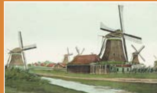
De Kater met links Het Pinksternakel, ansichtkaart van oost-Zaandam, van een aquarel van Gerrit Mol

Omdat de molen in het Olieslagerscontract was verzekerd is er een zeer uitvoerig rapport bewaard gebleven