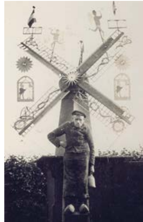
9 Maarten Bas met zijn mooi gezette biksteenmolen en zakje biksteen in de hand

Zeilenmaker liggen links buiten voor de molen de reserve stenen onder een piramidevormig afdak. Zo waren ze beschermd tegen inwateren. Zandsteen was kwetsbaar en kon breken als het nat werd en bevroor. Bentheimer zandsteen (Foto 8) werd net over de grens uit Duitsland aangevoerd via de Overijsselse Vecht. Bentheimer stenen spatten snel stuk bij een hoog toerental en zware belasting volgens molenmaker Gerrit Husslage. Deze kwaliteit bleek beter geschikt om gebouwen mee te maken zoals het paleis op de Dam te Amsterdam. Jammer genoeg bleek deze steen in de twintigste eeuw slecht bestand tegen de toen veel aanwezige zure regen en veel blokken moesten worden vervangen. Pelmolens die braken werden ook handelswaar, zoals blijkt uit het verhaal bij deze foto (Foto 9). Dit is Maarten Bas