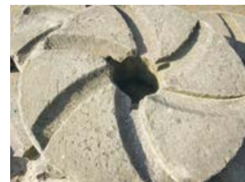
6 Pelsteen loper gezien aan de onderzijde

Deze pelsteen (Foto 6) had zogenaamde windkerven aan de onderzijde die het pelgoed zoveel mogelijk richting rand en blik dreven. Als legger werd vaak een oude rijststeen gebruikt; deze was iets harder dan de loper.