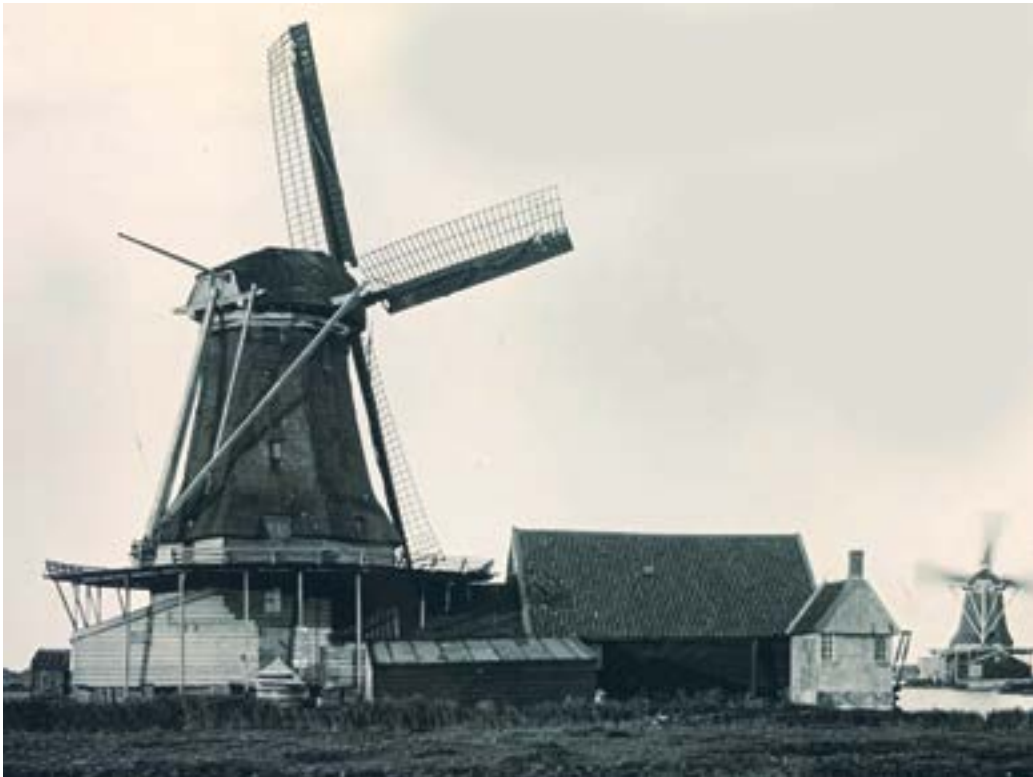
7 Pelmolen De Zeilenmaker te Oost-Zaandam, verbrand in 1925