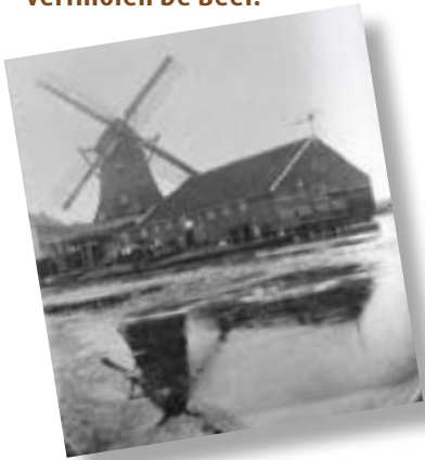
Verfmolen De Beer gezien vanaf de Zaan in noordwestelijke richting. Op de achtergrond links een stukje van het nog bestaande pakhuis Wormerveer.

Bijna twintig jaar geleden verdween, vrijwel geruisloos, een oud houten bedrijfspand aan de Veerdijk in Wormer. Wat veel mensen niet wisten, was dat een deel van dit pand bestond uit de oude molenshuur van oliemolen en later verfmolen De Beer.