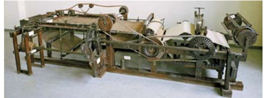
Papiermachine uit Deutsche Museum München, te vinden op de website van Stichting Zaanse papiergeschiedenis

Over papiermolen Het Fortuin (1720 – 1894) is in het Molenmuseum een fraaie tentoonstelling te zien. In 10 hoofdstukken volgen we de opkomst en ondergang van de molen die eerst slachtoffer werd van een mislukte mechanisering en 50 jaar daarna jammerlijk tot de grond toe afbrandde. Beide rampen konden de molen zelf niet worden aangerekend: het vuur begon in 1894 in de naastgelegen molen Het Guiswif, de mechanisatie mislukte in 1837 door onkunde van leveranciers.