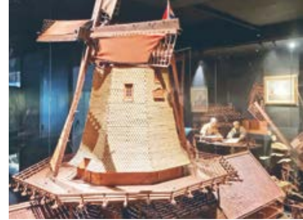
Detail van het model van De Eendragt, gemaakt voor de Parijse wereldtentoonstelling in 1900; op de achtergrond is in een andere vitrine het traditionele papierscheppen met de hand te zien

Inmiddels richtten drie neven Van Gelder Zonen op. Dat bedrijf kocht in 1845 de