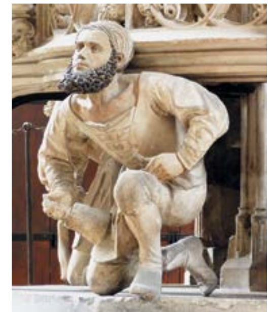
10 Adam Kraft onderaan de sculptuur in de St. Lorenzkirche in Nürnberg