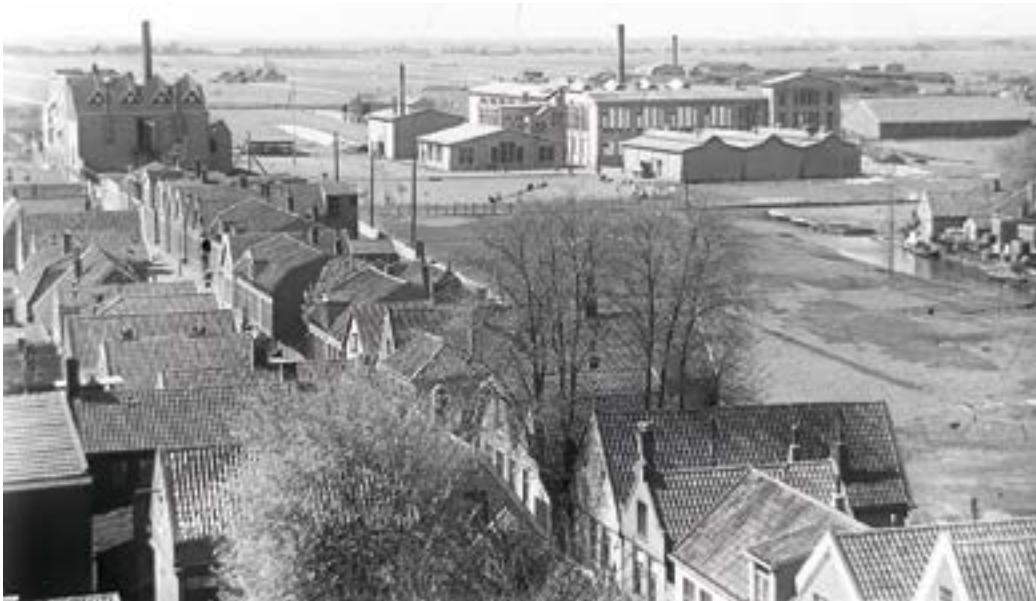
Omstreeks 1920: Op de voorgrond het Zonnewijzerspad, linksboven de Waxinefabriek, midden de Biscuitfabriek en rechts het terrein voor de Beschuitfabriek van 1927

stonden de deuren altijd open. Het rook er naar vers gezaagd hout en soms kregen we van timmerbaas Stolp een 'stukkie' zoethout van twee centimeter. "Van zoethout zaagt men zoete planken", was zijn standaard grap. Achterin de straat bij de Waxinefabriek hing ook een lekkere lucht. Het was niet precies die van kaarsvet, maar het had iets. Je was dan al langs het honingpakhuis gelopen en ook de geur daar was niet te versmaden.