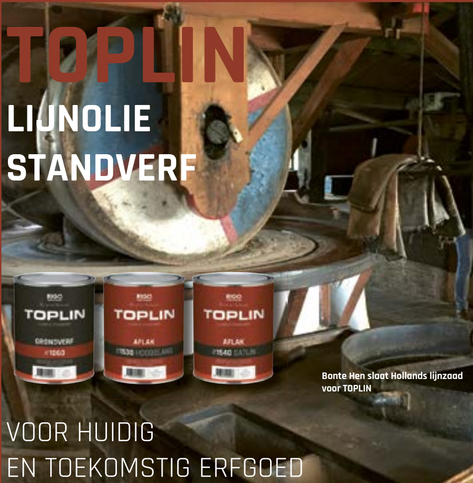
Bonte Hen slaat Hollands lijnzaad voor TOPLIN