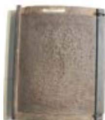
3 Blikblok van pelmolen De Jonge Prinses waarop gaatjes in het blik werden gemaakt

een spijker scherpe puntjes naar binnen zijn geslagen (Foto 3). Zo ontstaat er een grote rasp die de schil van de gerst of rijst er met veel kracht aftrekt. Bij gerst moest deze bewerking soms wel zes keer plaatsvinden om er bijvoorbeeld parelgerst van te maken (Foto 4).