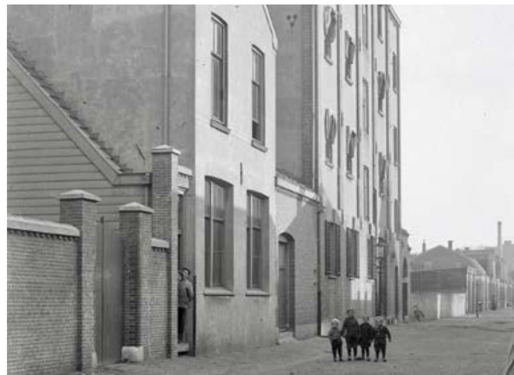
1903: Vier jonge Reigerstraters voor de pas gebouwde Waxinefabriek

Want zelfs nu, 60 jaar later, ken ik ze nog steeds; hun stemgeluid, hun oogopslag en het karakter van allemaal! Dit zijn de meest pure Zaankanters bij wie de gemeenschapszin in- met- en rondom de fabrieken ongekend was! We houden natuurlijk allemaal heel veel van groene getrapte wegen, molens, Czarenwoningen en pakhuizen, maar je jeugd beleven tussen die fabrieken, dat is óók uniek Zaans erfgoed!