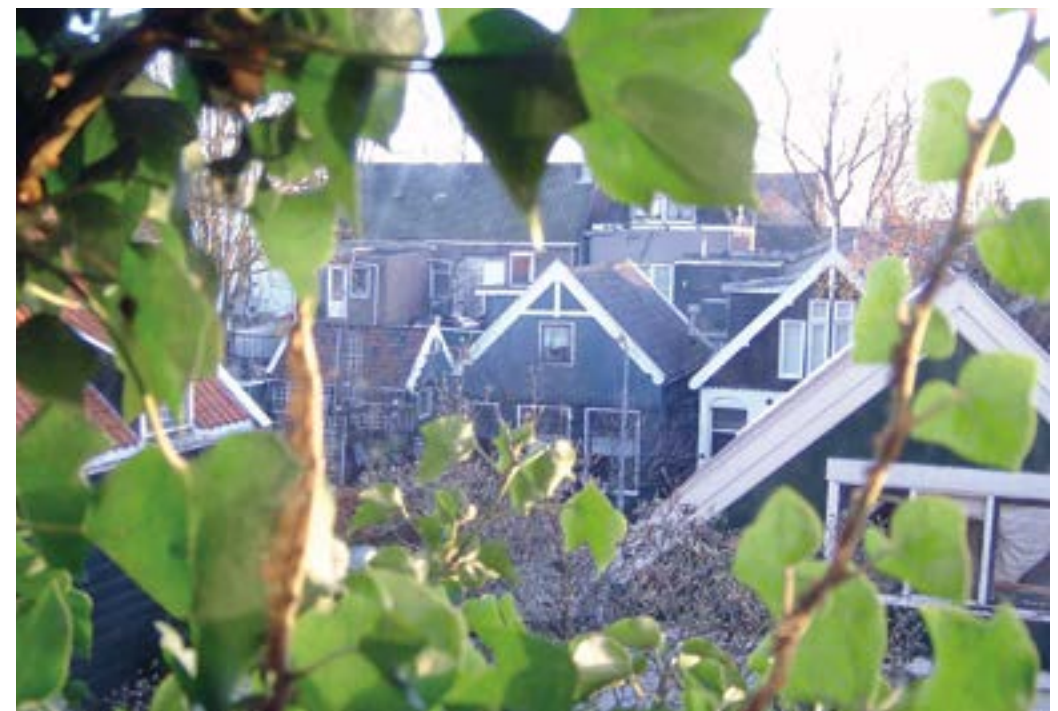
Zicht op Reigerstraat 25 vanuit het door klimop overwoekerde voormalige hoofdkantoor van Verkade boven de Beschuitfabriek

Na twee jaar kleuterschool aan de Valkstraat gingen veel Reigerstraters naar de Ooievaarstraatschool. En op zondag liep de straat leeg naar de kerk. Wij liepen naar de