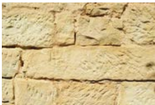
1 Blokken zandsteen

Zandsteen bestaat voornamelijk uit zandkorrels met wat toevoegingen van klei of gips, vaak grijs door verwerking (Foto 1). Doordat het kwartsstof dat bij de bewerking vrij kwam schade aan de longen veroorzaakte (silicose), werd in 1951 bij wet verboden om het in Nederland te verwerken. Vervangende steensoorten bleken echter zeer snel te verweren en dus is sinds 2005 onder strenge voorwaarden, zoals afzuiging en adembescherming, verwerking weer toegestaan.