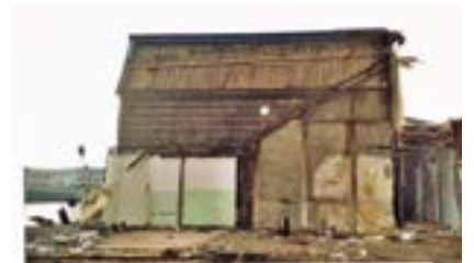
In oktober 2004 is de afbraak in volle gang, de contouren van de schuur zijn nog zichtbaar tegen het pakhuis.