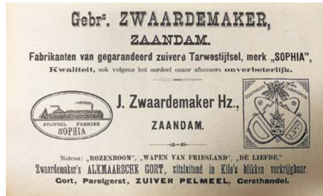
4 Zwaardemaker had nog drie pelmolens om parelgerst te maken