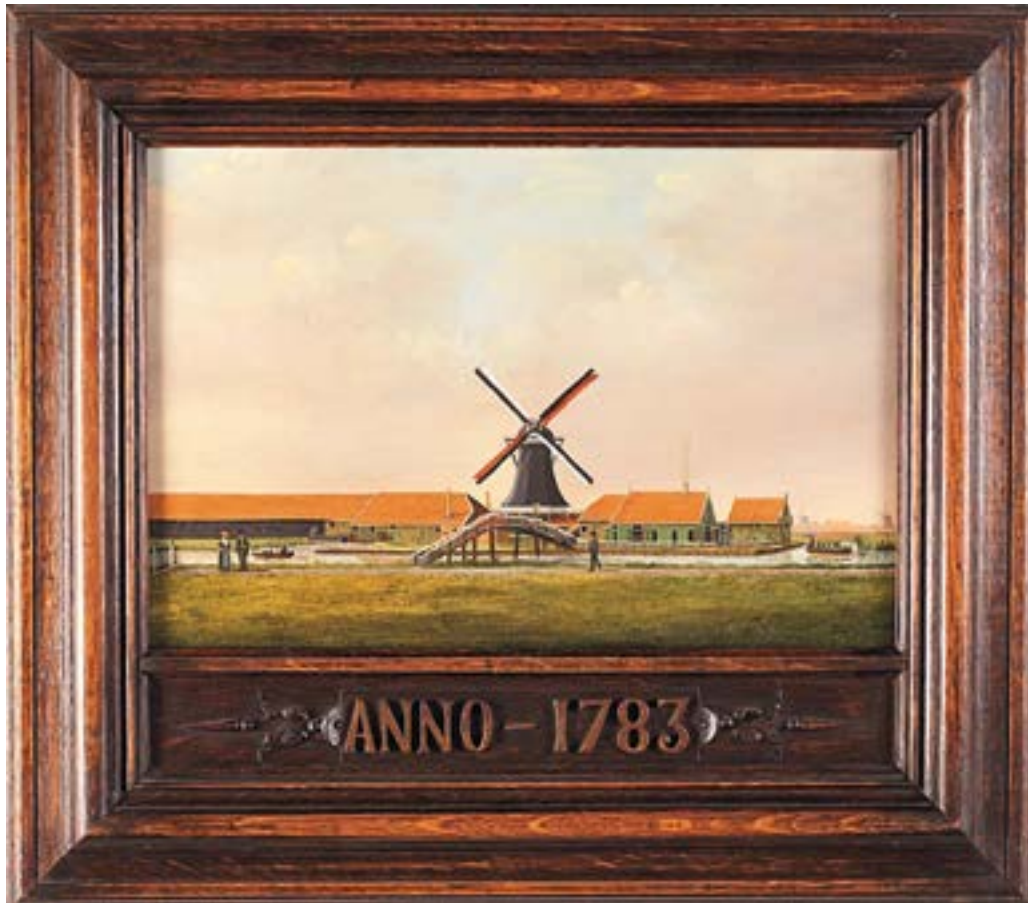
Het Fortuin, anoniem, olieverf op paneel, formaat ca. 50 x 57 cm. (begin 19e eeuw)

Het beste papier ter wereld werd in de 18e eeuw gemaakt in Zaanse molens.