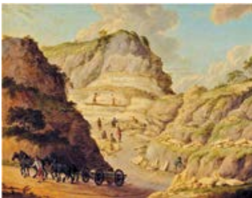
8 Groeve Bad Bentheim, 17e eeuw

Vanwege de veelvuldige breuk van het zachte zandsteen hadden pelmolens vaak zes stenen in voorraad bij de molen, meestal in een apart 'stienhok' zoals bij Het Prinsenhof te Westzaan. Zo konden de molenmakers bij breuk snel een nieuwe steen aanbrengen en stond het bedrijf niet te lang stil. Bij De