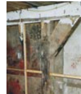
Oktober 2004 kort voor de afbraak, stijl met korbeel en legeringsbalk van de schuur, op het schot nog enkele initialen en jaartallen uit een ver verleden.