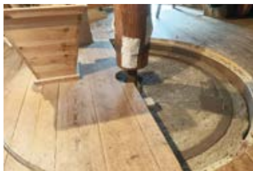
2 Pelsteen in molen De Koker te Wormer met rechts aan de rand van de lopersteen het pelblik

Onder deze lopersteen zitten grote uitsparingen gehakt, de zogenaamde windkerven, die ertoe bijdragen dat de gerst of rijst zo snel mogelijk richting de zijkant van de steen wordt gedreven. Rondom de zijkant van de steen zit een houten kuip met blik beslagen waarin met