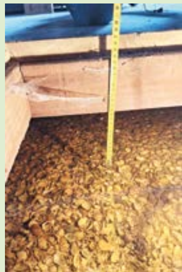
Het grondwater onder de vloer