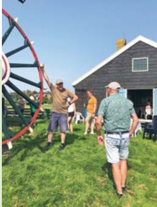
Gezellige drukte op de Open Monumentendag

Elk jaar brengt het najaar enkele hoogtepunten voor onze meel- en pelmolen. Eén van die hoogtijdagen is de Open Monumentendag, waarop dit jaar door enthousiaste vrijwilligers meer dan 140 pannenkoeken werden gebakken voor de vele bezoekers van deze zeer geslaagde dag. Het tarwemeel, het belangrijkste ingrediënt van het pannenkoekenmeel, hebben we zelf gemalen met onze maalstoel, die we daarvoor grondig schoongemaakt en opnieuw afgesteld hebben. De stenen bleken nog uitstekend te functioneren. Ook de Zaanse Molendag was een geslaagde dag. Traditioneel krijgen we op die dag geïnteresseerde molenaars op bezoek die van heinde en verre komen. Deze keer ontvingen we collega's uit onder meer Anjum in Friesland, Dalen in Drenthe en Hoogmade in Zuid-Holland. Zelfs