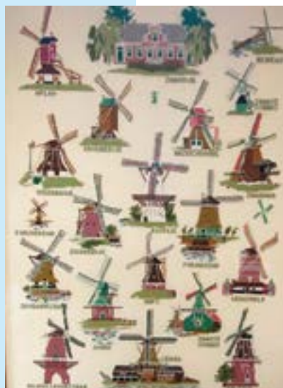
Het geschonken borduurwerk