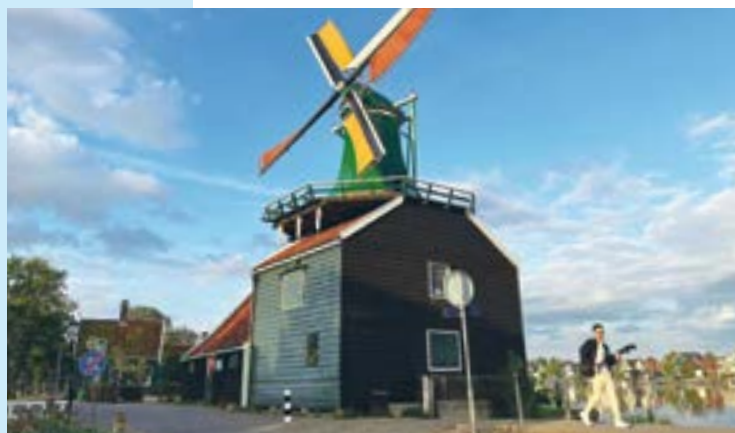
De molen met winterzeilen