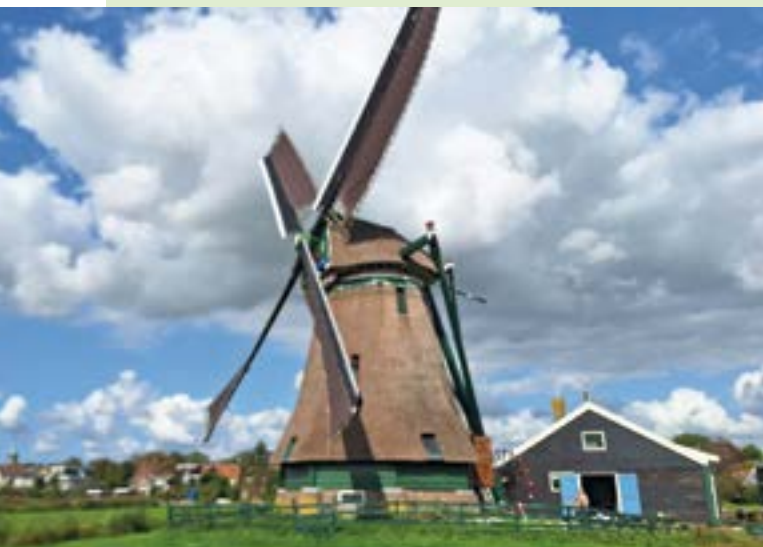
De molen met winterzeilen en een oer-Hollandse lucht