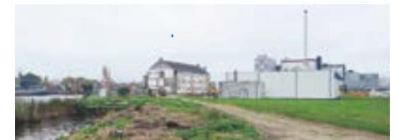
De situatie op woensdag 11 oktober 2023. De Beer stond op het terrein waar de scheepvaartborden staan; op de achtergrond pakhuis Wormerveer en cacao-fabriek de Moriaan.