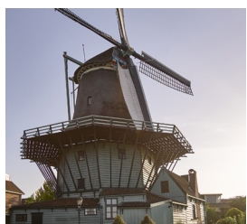
De Bleeke Dood