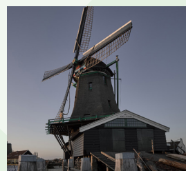
Het Jonge Schaap