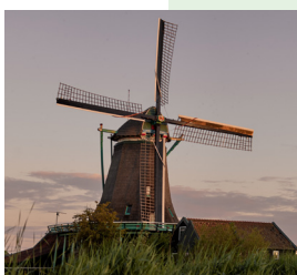
De Bonte Hen