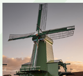
De Gekroonde Poelenburg