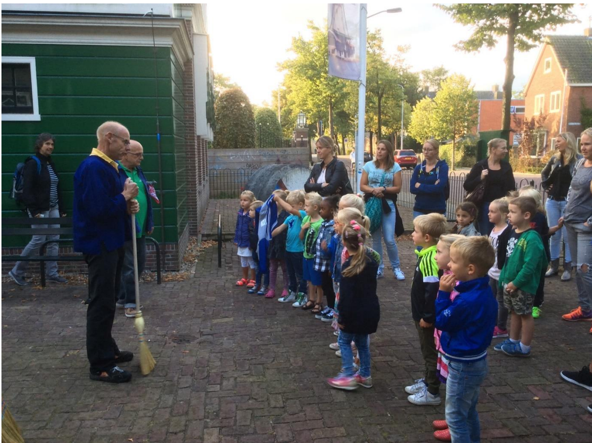
Museumdocenten ontvangen een groep voor Plus de molenmuis