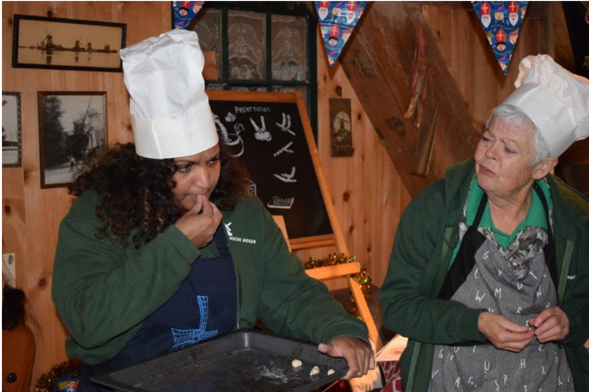
Sint en het verdwenen kruid

Onze museumdocenten, deels uit het onderwijs, hebben in 2018 een Sinterklaasprogramma bedacht, dit vanwege de intocht op de Zaanse Schans: "Sint en het verdwenen kruid". Er is een prentenboek bij gemaakt dat de scholen kregen opgestuurd. Het was een groot succes; 40 klassen in 2 weken zijn er geweest bij molens De Bleeke Dood en De Huisman. Sommige scholen moesten we teleurstellen. Vandaar dat het in 2019 een vast programma-aanbod in november is geworden.