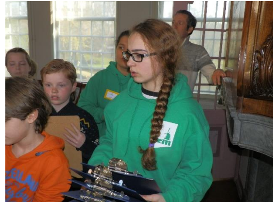
Leerling van De Faam