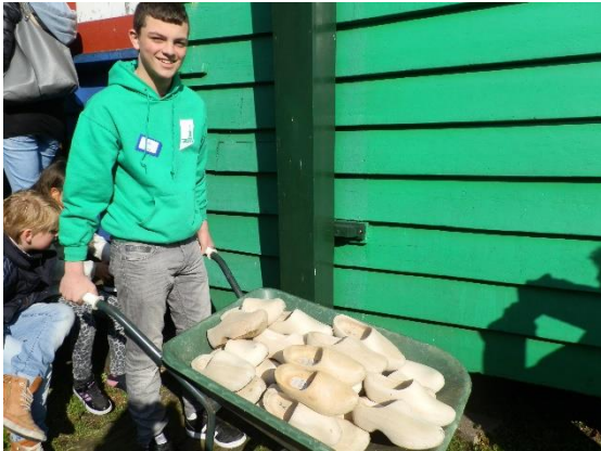
Leerling van De Faam

Natuurlijk was het mogelijk voor ouders en grootouders met hun kinderen dit programma ook te doen buiten schooltijden. Zo bereiken we nog meer kinderen. Op je klompen naar je werk! wordt begeleid door medewerkers van het Molenmuseum en vrijwilligers van de Educatiegroep van De Zaanse Molen. Tevens hebben we weer veel ondersteuning gehad van leerlingen van De Faam, de maatschappelijke stagiaires.