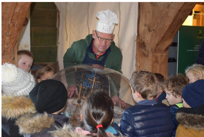
Schoolklas voor programma Sint en het verdwenen kruid

De rondleidersgroep is het afgelopen jaar druk in de weer geweest met de diverse projecten voor de schoolgaande jeugd, waarbij in combinatie van Het Molenmuseum en diverse molens instructieve en educatieve programma's werden geboden. We noemen "Van dik hout zaagt men planken", "Pluis de Molenmuis", "De meester schrijft nog op papier", "Molen voor-proefje", "Meel mop de billen" en "In de olie".